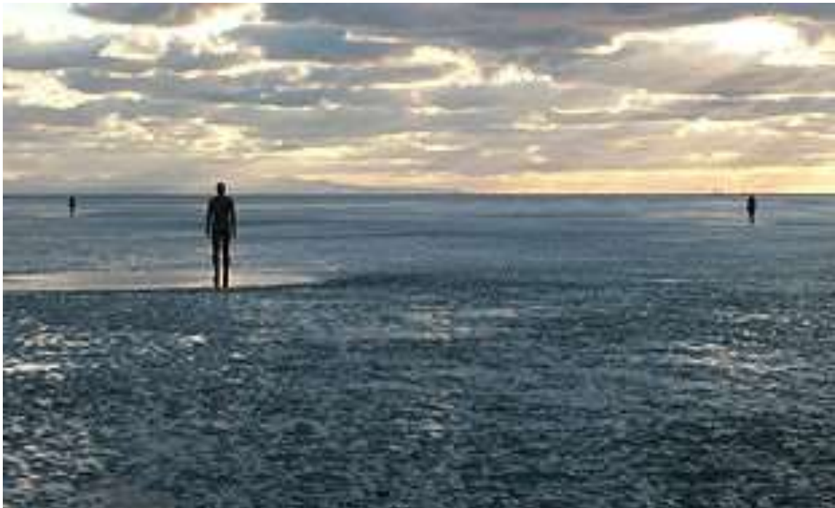
Another Place (Un altro posto) di Antony Gormley

“Legatevi all’uomo che guarda fuori dalla finestra e tenta di capire il mondo.”